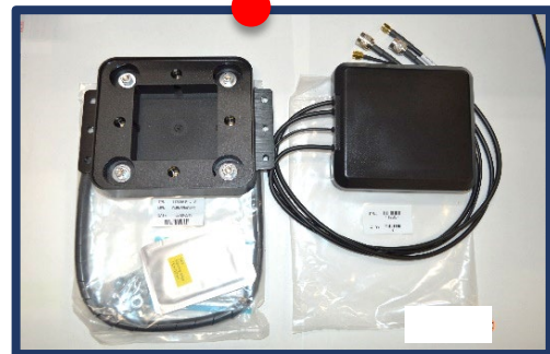
112056 / 112057